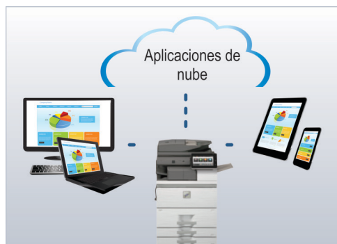
Distribuya, acceda e imprima documentos de manera más fácil.