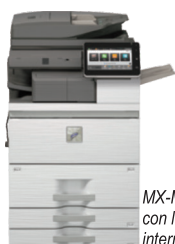
MX-M7570 se muestra con la acabadora interna (opcional).