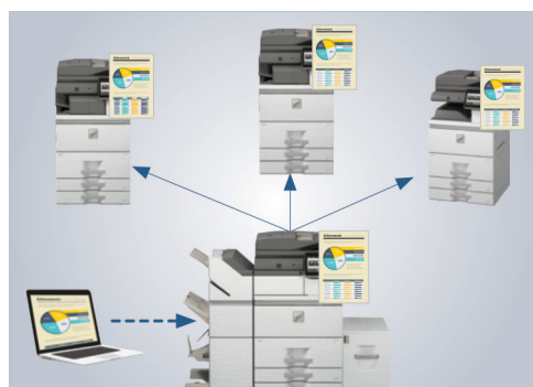
Con Liberación de Impresiones Sin Servidor puede imprimir un trabajo y liberarlo de manera segura desde seis modelos soportados (incluyendo al host).