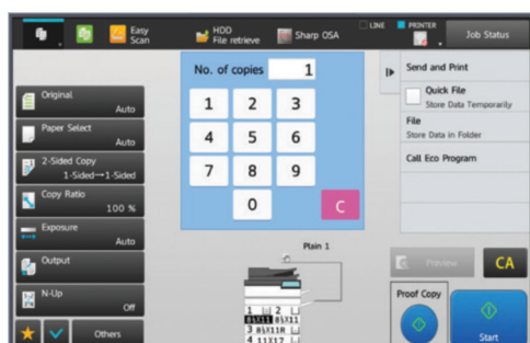
La Pantalla de Copiado estándar ofrece funciones más avanzadas.

Conectar una impresora multifuncional (MFP) a su red inalámbrica y accederla desde dispositivos móviles nunca ha sido tan fácil como con las funciones de conexión en red inalámbricas estándar de MX-M6570 y MX-M7570. Imprima desde o escanee a servicios de nube populares como Microsoft OneDrive for Business, SharePoint Online y Google Drive con la función de Conexión a Nube de Sharp . El soporte de un solo inicio de sesión (SSO) para acceder estos servicios hace que las operaciones de escaneo a carpeta y escaneo a correo electrónico sean más fáciles que nunca. Incluso imprimir desde su escritorio es más fácil con la función de Liberación de Impresiones Sin Servidor de Sharp . Envíe un trabajo sin problemas a un dispositivo, e imprímalo en otro en el momento y lugar más convenientes para usted.