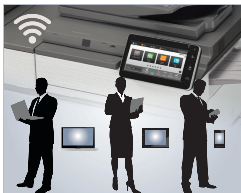
La interfaz de red inalámbrica integrada hace posible el escaneo e impresión convenientes desde dispositivos móviles.

Cuando se trata de cumplir con un trabajo, los sistemas de documentos monocromáticos MX-M6570 y MX-M7570 se desempeñan excelentemente. Escanee rápidamente documentos a velocidades de hasta 200 imágenes por minuto . El reconocimiento de caracteres ópticos (OCR) integrado puede convertir sus documentos escaneados en formatos de archivos de PDF con capacidad de búsqueda de texto o de Microsoft Office , simplificando su flujo de trabajo. Utilice la función de engrapado manual (opcional) para engrapar sus documentos originales. Las múltiples funciones de acabado le ofrecen los resultados que requiere, ya sean de apilado, engrapado o encuadernación en caballete. Incluso existe una función integrada de acabado sin grapas que es capaz de unir cinco hojas de papel con un pliegue en la esquina del juego de hojas, lo que ahorra grapas para juegos más grandes.