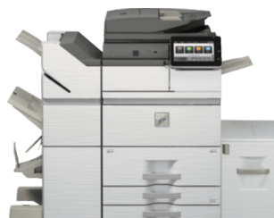
MX-M7570 se muestra con la acabadora de encuadernación en caballete 3K y depósito de gran capacidad (opcional).