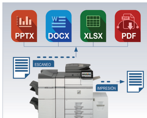
Escanee y convierta documentos a formatos de archivos populares sin problemas con la función OCR integrada de Sharp.

La tecnología OSA de Sharp puede ayudar a que su negocio aproveche el poder de sus aplicaciones de red, sistemas back-end y servicios de nube. 2 Automatiza fácilmente procesos complejos y ayuda a eliminar tareas redundantes. Crea sus propias integraciones personalizadas o toma ventaja de la cartera creciente de aplicaciones OSA de Sharp disponibles de los miembros del Programa de Socios de Sharp.