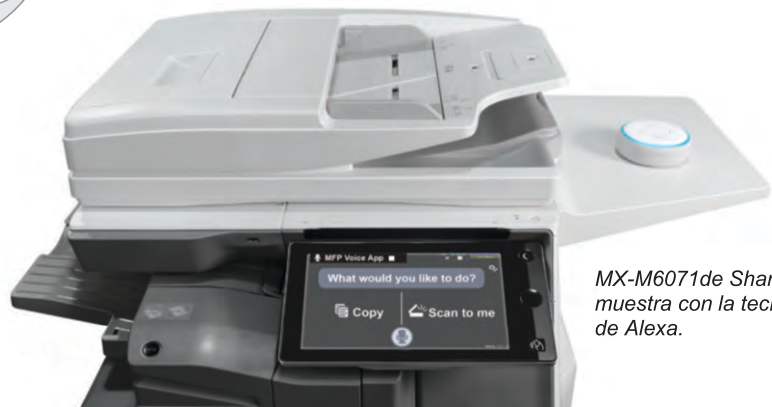
MX-M6071 de Sharp se muestra con la tecnología de Alexa.

“Alexa, pide a la copiadora de Sharp que escanee por mí”.