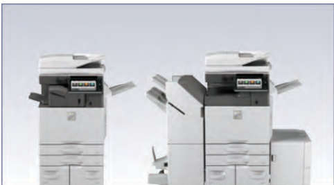
MX-M6071 se muestra en la configuración compacta con acabadora interna y en la configuración completa con acabadora de encuadernación a caballete y depósito de gran capacidad.