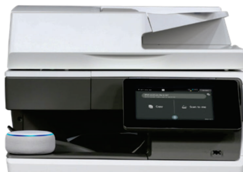
MX-C304W se muestra con la función de Voz MFP de Sharp disponible con la tecnología Alexa.

"Alexa, pide a la copiadora Sharp que escanee para mí".